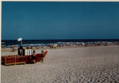
En la playa hay todos los servicios indispensables.

les ha permitido alcanzar un bienestar muy superior a quienes no han sabido aprovechar su privilegiada población geográfica y su clima. Van adquiriendo un peso específico, que se traduce en mejores servicios y en mayores inversiones de la Administración para permitir crear nuevas y mejores infraestructuras.