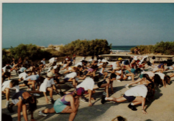
El costado de la playa y su entorno, un estímulo para la vida sana y deportiva.

Otras mejoras han sido la adquisición de una nueva barredora, aumento del personal que cuida