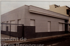
El nuevo ambulatorio será inaugurado la próxima primavera.

Todos tenemos la responsabilidad de fomentar la idea de que la Playa y el pueblo son la misma cosa; en definitiva: Canet d'En Berenguer. Y el Ayuntamiento tiene la obligación de atender los dos núcleos por igual, sin perder de vista que la Playa es el presente y el futuro de Canet.