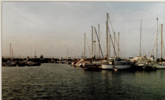
Crecer el número de barcos, en un port que sorprende a les turistes.