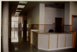
Entrada del ambulatorio desde la sala de espera y especialidades.

FAR. —Su planteamiento puede ser correcto, pero la realidad nos dice que existe un cierto malestar en algunas personas, que afirman que todo es para el pueblo y que la Playa está un poco desatendida, ¿qué puede contestar al respecto?