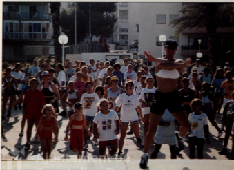
Las actividades que dirigimos las realizamos en la playa siempre para el deporte y la diversión.

Estamos haciendo un esfuerzo para desarrollar una política turística que nos permita darnos a conocer en aquellos sectores que puedan traer riqueza a Canet: el de la construcción ya se ha apercebido de dónde debe invertir y espera-