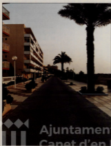
La arquitectura de Canet junto al mar guarda siempre la estética.

mos que, como consecuencia de ello, otros empresarios decidan establecerse aquí y mejorar algunos aspectos de los que adolece nuestra población.