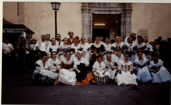
El grupo de danza de Carot.

Dentro de la programación cultural podemos resaltar la consolidación de nuestra Banda de música y su Escuela, que, día a día, incrementa su número de componentes y, lo que es más importante, su calidad. Uno de los acontecimientos que demuestran su valía ha sido su desplazamiento a Madrid para celebrar un concierto en la Plaza Mayor de la capital de España.