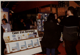
Fue muy visitado el stand de Canet, en FITUR, la gran feria del turismo mundial celebrada en Madrid.

Como responsable de la Concejalía de Turismo, debemos señalar la enorme importancia que ha adquirido esta parcela en nuestro municipio. Sin desmerecer a las demás —algunas de las cuales están también bajo mi dirección— podemos decir que es la de mayor responsabilidad, en una localidad como la nuestra, cuya economía está cada vez más vinculada al turismo. Hoy día, Canet está catalogada como población turística y así debe ser reconocida por la Administración Autonómica a la hora de conceder las subvenciones, que