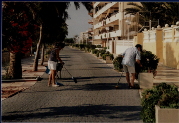
EL PASSEO MARÍTIMO, IMPECABLE