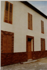
Esta antigua casa de labos, totalmente restaurada, albergará dos Salas-Museo, Sala de Exposición, Sala de Juntas y el proyecto de una Escuela de Formación Ocupacional. Será el Museo de Canet.

R- Esta maqueta ha sido la más difícil de todas porque nada es