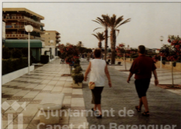
El paseo marítimo era imprescindible hace años.

Continuar por este camino es la meta que nos hemos de marcar. El hecho de que Canet pertenezca al Consejo Sectorial de Turismo de la Diputación y tener este año un stand en Fitur (Feria Internacional del Turismo de Madrid) compartido con Xàtiva, Sueca, Boicarent, Tabernes de la Valldigna y Requena, supone darnos a conocer en un foro al que asisten miles de profesionales del sector turístico. En mayo también estaremos en el Saló Internacional de Turismo de Barcelona.