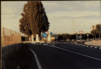
NUEVA ROTONDA CALVARIO