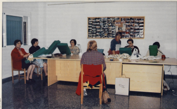
CURSO DE BOLLILLOS - AMAS DE CASA

Como siempre, es un placer dirigirme a todos vosotros desde estas líneas, para comentaros nuestro trabajo a lo largo del tiempo pasado desde la última publicación de nuestro B.I.M.