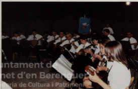
CONCIERTO DE SANT PERE

Rondalla "Sant Pere" - Canet d'En Berenguer