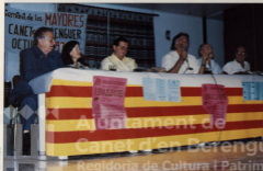
CLAUSURA SEMANA TERCERA EDAD