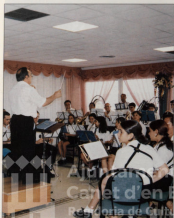
CONCIERTO EL DIA DE LA TERCERA EDAD