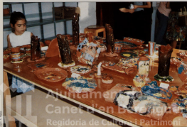
CERÁMICA 87 - CLAUSURA DEL CURSÓ 1996-97