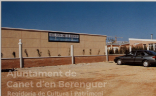
Ajuntament de Canet d'en Berenguer Regidoria de Cultura i Patrimoni Regidoria de Participació Ciutadana

Asimismo, se ha impreso una nueva colección de ocho postales que vienen a sustituir a las antiguas, y que recogen lo más actual y sig-