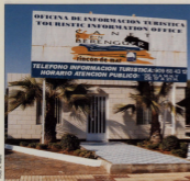
OFICINA DE INFORMACIÓN TURÍSTICA EN EL PASEO MARÍTIMO