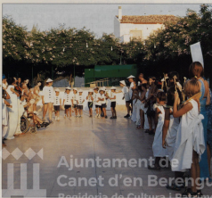
FEI-TA H DE CURS

Aquest estiu ha seguit el que fa tres per a la nostra escola d'estiu. Podem parlar ja d'un projecte que s'ha consolidat, i que any darrere d'any, va arrasant un important número de xiquets i xiquetes.