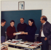
ENTREGA DE LIBROS