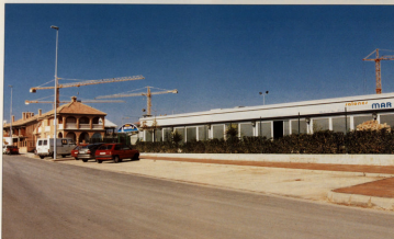
NUEVO ASPECTO DEL SECTOR A

Por fin se movió el Sector A. No podíamos seguir con el proyecto de Urbanización paralizado. A instancias de la Junta de Compensación y por acuerdo de la Asamblea General, se acordó iniciar contactos con el Ayuntamiento con el fin de que éste se hiciera cargo por delegación de la propia Junta, de que las obras de Urbanización se completasen, comprometiéndose el Ayuntamiento a hacer cumplir los compromisos de pago de los propietarios que no lo hubieran hecho, bien por vía voluntaria o por la vía de apremio.