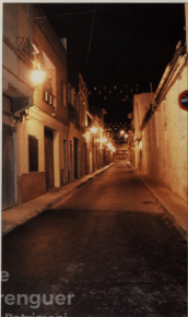
NUOVO ALUMBRADO PÚBLICO