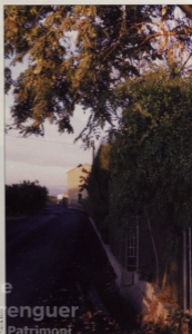
MEJORA DEL CAMÍ DE LA RIF