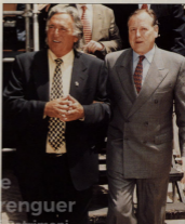
NUESTRO ALCALDE Y EL ALCALDE DE MADRID