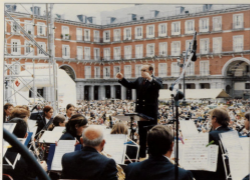
CONCIERTO EN LA PLAZA MAYOR DE MADRID

El destino fue Madrid. El objetivo muy ilusionante: ver actuar en la Plaza Mayor de la Capital de España a nuestra Banda Municipal con motivo de las Fiestas de San Isidro, en la celebración del Día del Cocido Madrileño, organizado por el Ayuntamiento de Madrid, con la colaboración de Aldeas Infantiles.