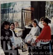
AYUDA A BOSNIA

Podemos afirmar, sin temor a equivocarnos, que este año, la campaña en beneficio de los niños de Bosnia, ha sido todo un éxito.