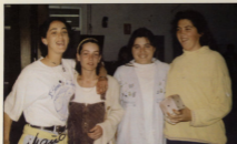
Guanyadores de partits.

És molt gran per a mi, eixir en aquesta publicació per primera vegada com responsable de l'àrea de Joventut de l'Ajuntament de Canet d'En Berenguer.