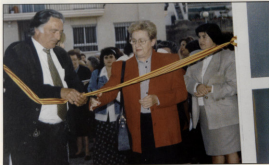
Inauguración nuevo local. Corte de la cinta por el Sr. Alcalde y la Presidenta Provincial.