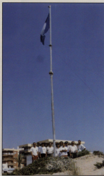
Bandera Aisl 1996