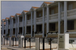
Una nueva concepción del Urbanismo

Como fruto de éstas y otras muchas gestiones se concretó con "Ferrobús" una gran operación constructiva, que si bien la idea de un hotel no entraba en sus planes, sí estaba dispues-