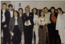
Equip de treball de la 1 Setmana de la Joventut.

La casa Lítaro s'adecuarà per a servir de CASA DE LA JOVENTUT i MUSEU.