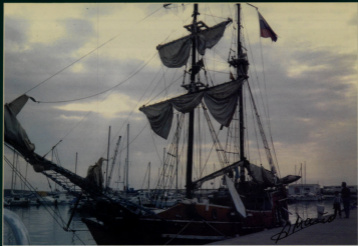
NAVEGANDO HACIA EL FUTURO