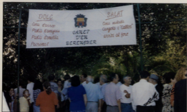
Festa Gastronòmica 9 d' Octubre

Gracias se está disfrutando la construcción del bloque de