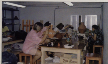
Escola Municipal de Ceràmica

Y al comienzo de curso, en octubre, tuvimos la satisfacción de empezar con dos nuevas escuelas: la de cerámica y la de "Danzó". No nos podemos olvidar tampoco de la rindella, que hará su debut ahora en las fiestas de S. Pedro y que nos va a dar muchas satisfacciones.