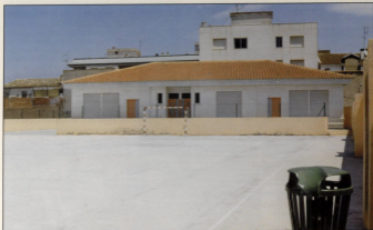
Ampliació del pati escolar.

Hem tardat molt en aconseguir que el pati de les Escoles s'ampliara. Des de l'Ajuntament ens congratulem de que per fi, els xiquets tinguin un pati dins de les escoles on poden jugar amples. Durants més de tres anys hem estat en tràmits per a l'adquisició dels terrenys. Problemes ajens a nosaltres ens impedié accedir a la compra total dels quasi 1.000 metres de terrenys en la "zona de reserva escolar", per a procedir a l'ampliació del pati de les escoles.