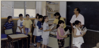
Entrega llibres any 95 / 96

Un any més, l'Ajuntament ha fet entrega dels llibres de text dels estudiants del col·legi del nostre poble.