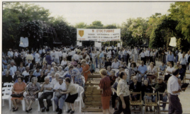
1 Trobada gastronòmica del Camp de Morvedre.

En los pueblos en que no había Asociación, visitamos los Ayuntamientos, para que nos pusieran en contacto con algu-