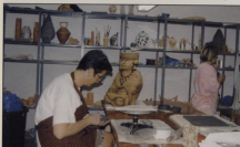
Escola Municipal de Ceràmica

A través de la "Campaña d'Hivern", de Diputació actuaron en enero y marzo de este año en el Centro Cultural, los grupos "Nana Teatre", con el espectáculo "Totes les sabimes del net", y "Botg Teatre", con la obra "Help".