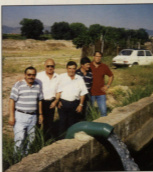
En Comunidad de Regantes

La financiación restante la gestionará a través de Entidades Bancarias con el fin de dilatar el pago por parte de los propietarios, y facilitar de esta forma el pago por etapas al agricultor.