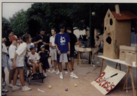
Classe a l'Escola d'Estiu a Canet